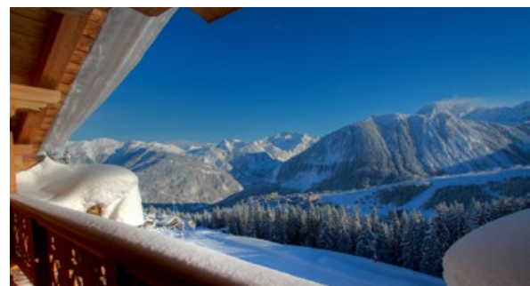
| Vue du bar du Strato