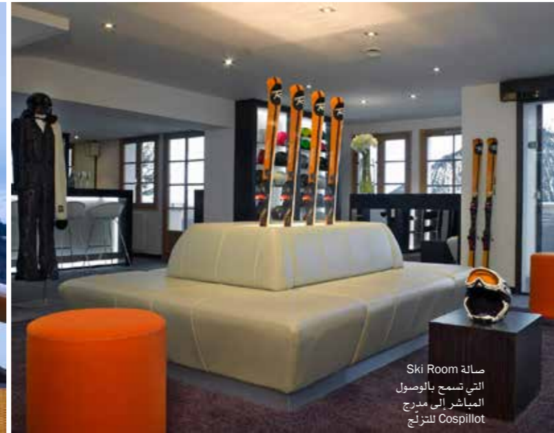
صالحة Ski Room التي تسمح بالوصول المباشر إلى مدرج التزلج Cospillot