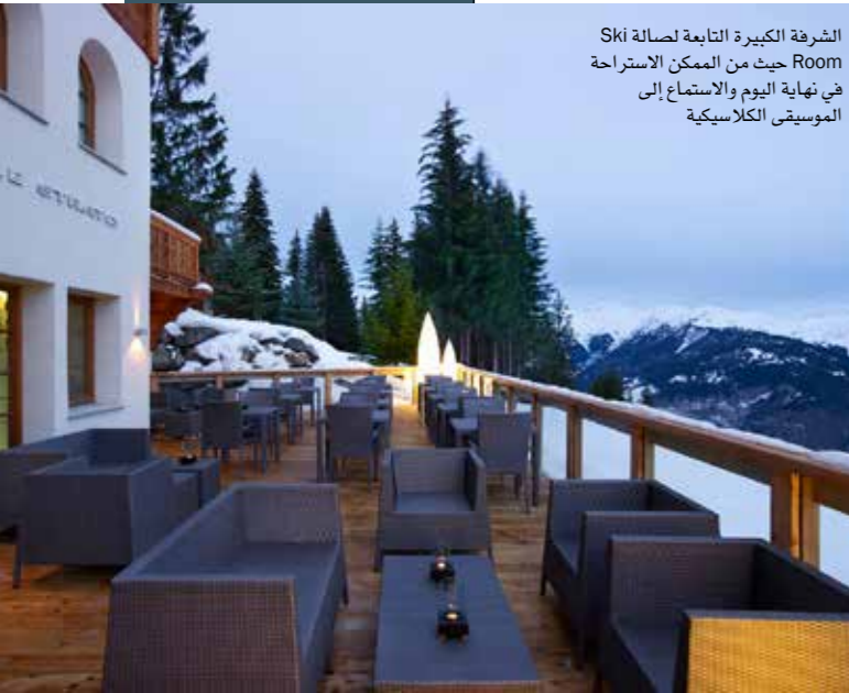
الشرفة الكبيرة التابعة لصالحة Ski Room حيث من الممكن الاستراحة في نهاية اليوم والاستماع إلى الموسيقى الكلاسيكية