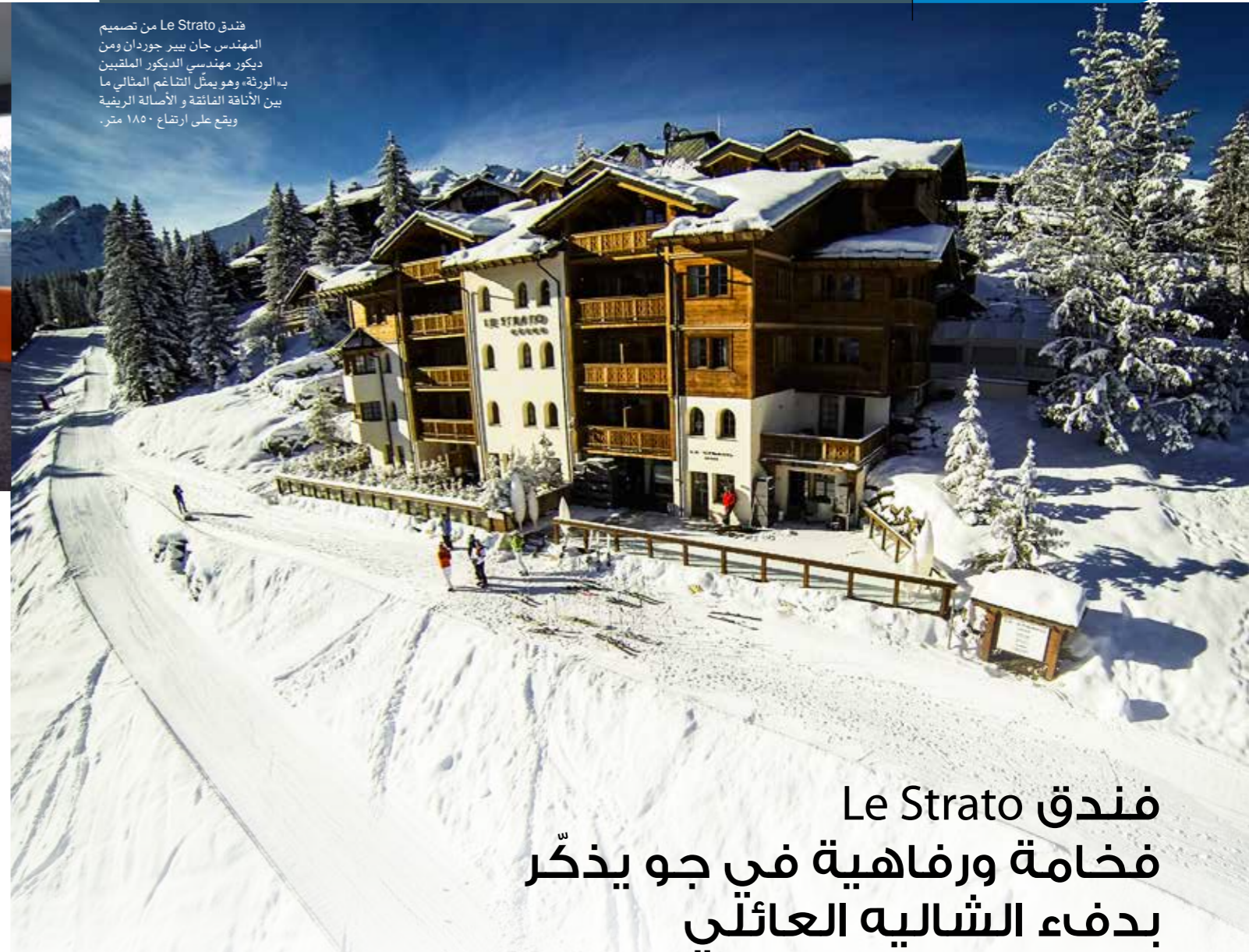
فندق Le Strato من تصميم المهندس جان بيير جوردان ومن ديكور مهندسي الديكور الملقبين بـ"الورثة"، وهو يمثل التناغم المثالي ما بين الأناقة الفائقة والأصالة الريفية ويتبع على ارتفاع ١٨٥٠ متر.