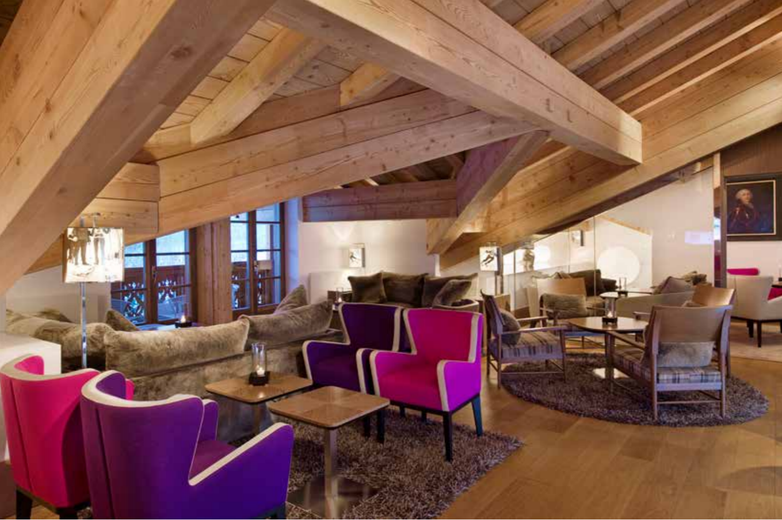
الجو الدافئ والحميم لبار الفندق